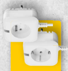
JB-162N-PLUG (French) JB-163N-PLUG (Schuko) Zweifachkontaktrelais mit externem Ausgang • max. 16 A • Laststrom (cos φ = 1) • Abmessungen: 70 x 70 x 77,6 mm