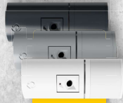
JA-122PC JA-162PC PIR-Bewegungsmelder mit Fotoverzerrung • PIR-Erfassungsbereich 90° / 12 m • Abmessungen: 65 x 30 x 44 mm