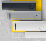
JA-T13M JA-T13M Magnetkontakten mit Erkennung externer Magnetfelder • Identifizierung 20 x 18 x 20 mm • Abmessungen: Sicherheitsabstand 3 m