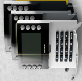
JA-T15E JA-T15SE Bedientafeln • RFID-Technologie • Abmessungen: 120 x 120 x 23 mm